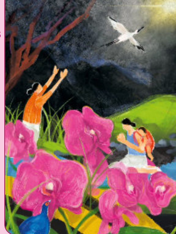
Das Titelbild zum Weltgebetstag 2023 stammt von der Künstlerin Hui-Wen Hsiao. Die Frauen auf dem Gemälde sitzen an einem Bach, beten still und blicken in die Dunkelheit. Trotz der Ungewissheit des Weges, der vor ihnen liegt, wissen sie, dass die Rettung durch Christus gekommen ist.

Heute ist Taiwan ein fortschrittliches Land mit lebhafter Demokratie. Gerade die junge Generation ist stolz auf Errungenschaften wie digitale Teilhabe, Meinungsfreiheit und Menschenrechte. Der